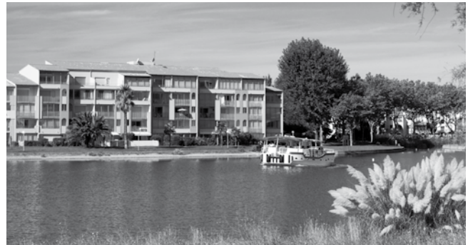
Exemple 2 pièces cabine

Appartement 2/4 Pers. 30 m 2 mit Loggia - Wohn-/Schlafraum mit Ausziehbetten, mit Schlafzimmer mit franz. Bett, Schränke. - Kochnische mit Kühlschrank, 2 E-Kochplatten, Minibackofen, Kaffeemaschine, Stauraum. - Staubsauger. - Dusche, WC. - Loggia mit Gartenmöbel. - TV.